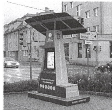
Abbildung 1 http://sol-energy.at/album/gemeinde-hirtenberg/