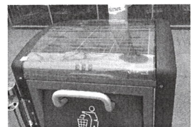
Abbildung 4 https://www.photovoltaiik.org/news/produkte/effektive-solar-muelleimer-12210